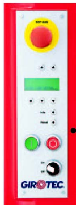
Cuadro Digital sencillo y compacto