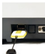
Salida RS232 y USB