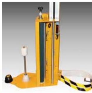
Sistema de seguridad con reflector y fotocélula. Parada de emergencia.