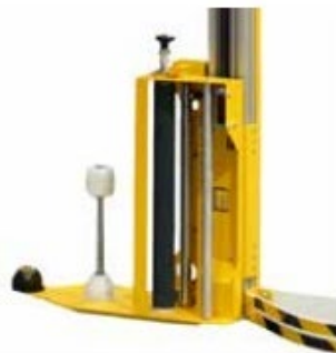
Carro portabobinas. Diseñado para una óptima aplicación de film.