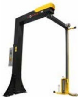
Brazo envolvente. Un brazo horizontal y un perfil vertical accionado por motor